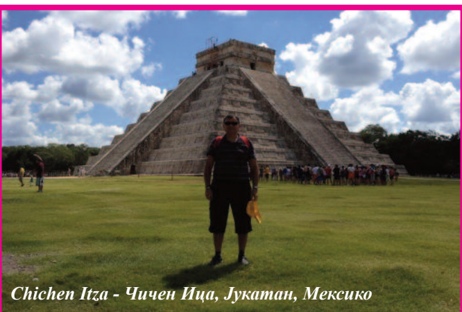
Chichen Itza - Чичен Ица, Јукатан, Мексико

А. Ж.: Знам да пуно путујете, па бих желела да Вас питам шта сте последње посетили и шта је оно што је оставило најјачи утисак на Вас?