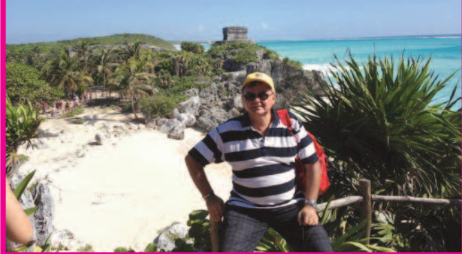
Тулум, Карибско море