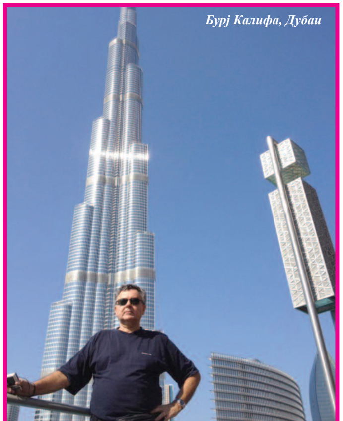
Бурј Калифа, Дубаи

Б. Р.: Ја сам овде завршио и основну и средњу школу. Тада је то била заједничка школа Срба, Словенаца и Хрвата. Сви смо били измешани, али увек се ту нашао и понеки Мађар који је био заинтересован да упозна нашу културу. То су била друга времена, али ја сам веома поносан што сам био ђак ове институције. Након средње школе завршио сам високу школу у Печују, данас је то факултет, а касније факултет Eötvös Loránd овде у Будимпешти. На позив тадашњег директора ја сам се вратио у школу, овога пута не као ђак већ као професор. Имао сам низ генерација које сам васпитао и којима сам био разредни старешина, и на које сам поно-