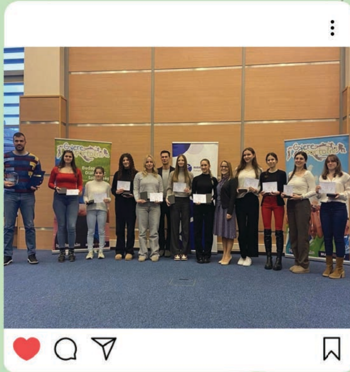
КОШАРКАШИЦЕ НА ДОДЕЛИ НАГРАДА ПОВОДОМ ПОБЕДЕ НА ЋАЧКОЈ ОЛИМПИЈАДИ